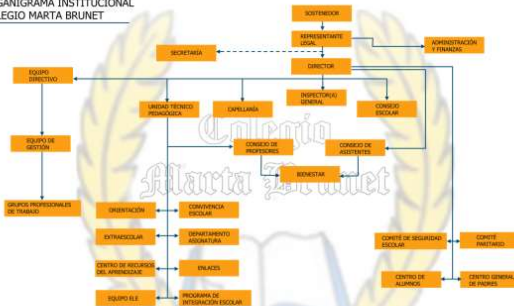
ORGANIGRAMA INSTITUCIONAL COLEGIO MARTA BRUNET

"Con la gracia de Dios para la comunidad"